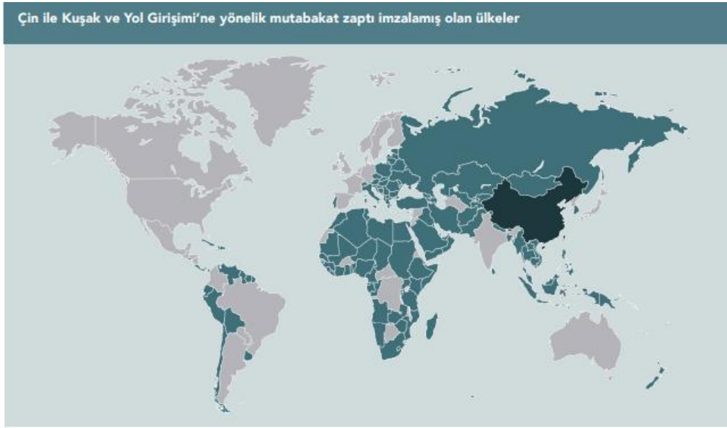
Şekil 1 Mutabakat Zaptı İmzalamış Ülkeler

KYG (Kuşak ve Yol Girişimi), Çin Devlet Başkanı Xi Jinping tarafından bir vizyon olarak 2013 yılında açıklanmış, sonrasında 28 Mart 2015 tarihinde Çin Ulusal Kalkınma ve Reform Komisyonu tarafından açıklanan eylem planı ile birlikte resmîyet kazanmıştır. 21. Yüzyıl'ın şu ana kadar en kapsamlı uluslararası ekonomik programı olarak tanımlanan girişim ile Asya ile Avrupa arasındaki bağlantıların, demiryolu, karayolu, liman, dijital altyapı ve enerji altyapısı üzerinden kuvvetlendirilmesi amaçlanmaktadır. Dolayısıyla KYG her şeyden önce güzergâh üzerindeki ülkelerin kendi içerilerindeki altyapının geliştirilmesi ve sonra da bu ülkeler arasındaki bağlantıların altyapısının kuvvetlendirilmesine yönelik bir girişimdir (DEİK, 2022:19).