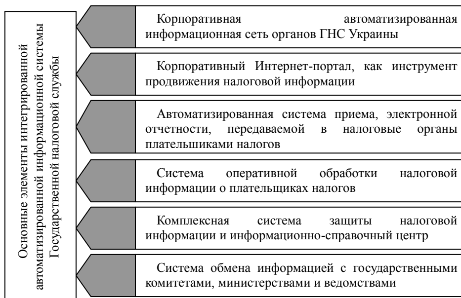
Рисунок 2. Схема предлагаемой интегрированной автоматизированной информационной системы ГНС Украины

Таким образом, формирование ИАИС на нынешнем этапе модернизации ГНС Украины позволяет внедрять новые услуги для плательщиков налогов и создавать мощные инструменты для выполнения требований предусмотренных Налоговым Кодексом Украины и другими законодательными актами в сфере налогообложения.