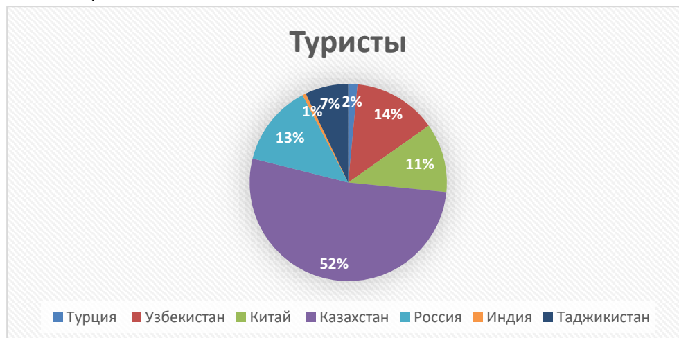
Диаграмма 2. Доля Туристов, Посетивших Кыргызстан Из Стран ВШП В 2018

Согласно статистическим данным Кыргызской Республики, в 2018 году численность иностранных граждан, пересекших границу Кыргызской Республики, составила 4,7 млн. человек. Основной поток иностранных туристов прибыл из соседнего Казахстана (52%), России (14%) и с самым низким показателем из Индии (0,6%), из них 1.4 млн. составили отдыхающие. Если анализировать число туристов, приехавших в Кыргызскую Республику из стран дальнего зарубежья, то они занимают небольшую долю: туристы из Турции - 1,2%, Германии и США - 1%. К сожалению, пока нет точных данных относительно их приезда с целью оздоровления.