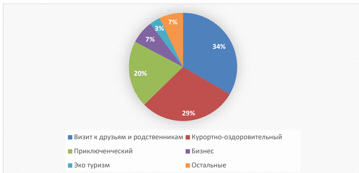
Диаграмма 3. Доля Туристов, Посетивших Кыргызстан Из Стран ВШП В 2018

Результаты выше сделанного анализа доказывают возможности перспективного развития медицинского туризма в республике по направлению профилактики и оздоровления, тем самым создавая возможности дальнейшего развития медицинского туризма в стране.